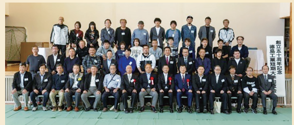
50周年記念同窓会 (R5. 10. 23)