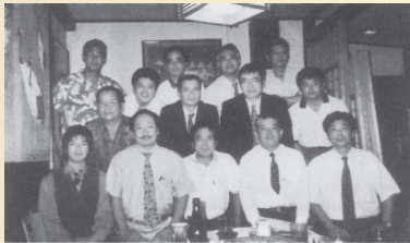
沖縄地区同窓会 集合写真 (H12. 9. 8)