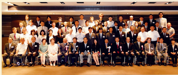
40周年記念同窓会 (H25. 9. 1)