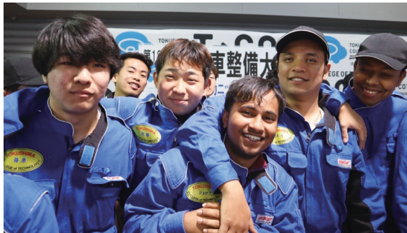
多文化共生を体感できる学習環境