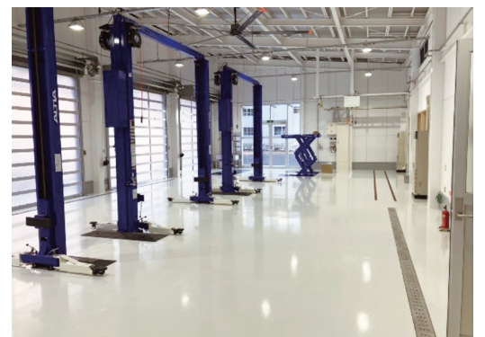
点検・検査 実習場