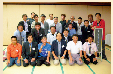
香川地区同窓会 集合写真 (H21. 10. 3)