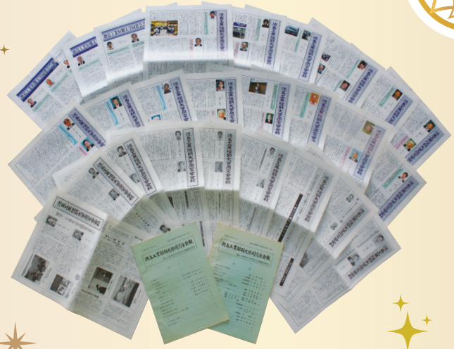
同窓会会報バックナンバー (No.1~28)