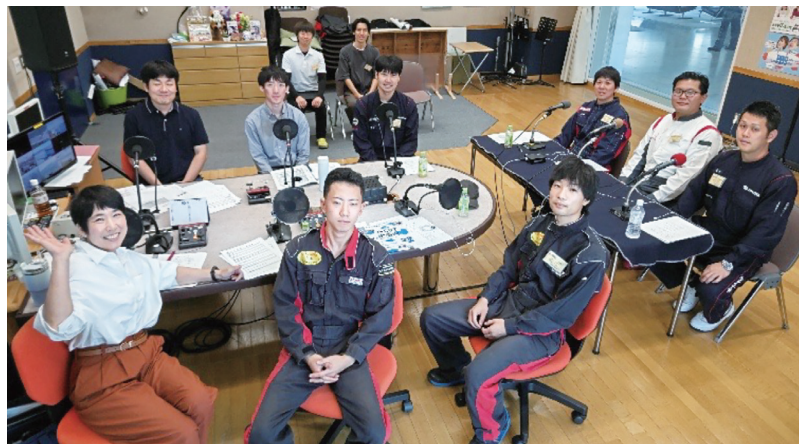
四国放送 ラジオ大福「T-COT へ行こう」と 隔週火曜日 10時10分から放送

企業との連携強化も本学の大きな特徴の一つです。企業奨学金制度の提携企業は年々増加し、現在では県内外38社と契約を結んでいます。学生にとっては経済的支援に加え、将来を見据えた学びや就職への安心感につながっており、企業・大学・学生がともに成長できる関係づくりを進めています。