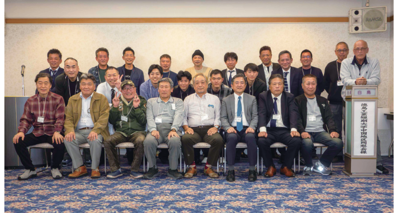
2025(R7年) 11月15日 ピュアリティまきび