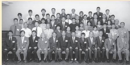
30周年記念パーティー (H15. 8. 24)