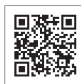
独立行政法人 日本学生支援機構 JASSO奨学金 QRコード